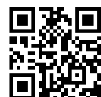
りんぐるホームページQRコード

三條市総合型地域スポーツクラブりんぐる事務局 住所/三條市新堀2113番地 一般社団法人 三條市スポーツ協会内 受付時間/月曜～金曜 午前9:00～午後5:00※祝祭日・年末年始は除きます。 【お問合せ】0256-45-1150